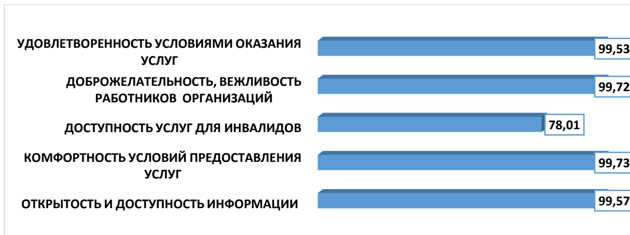
Диаграмма 1. Среднее значение рейтингов показателей, характеризующих общие критерии оценки качества условий оказания услуг организации социального обслуживания Челябинской области в 2023 году (в баллах)

Расчет среднего значения каждого отдельного критерия позволяет более детально рассмотреть результаты показателей оценки, выявить и оценить имеющиеся в организациях проблемы комфортности и доступности предоставляемых услуг. На диаграмме 1 видно, что по всем пяти критериям независимой оценки организации социального обслуживания показывают достаточно высокие результаты.